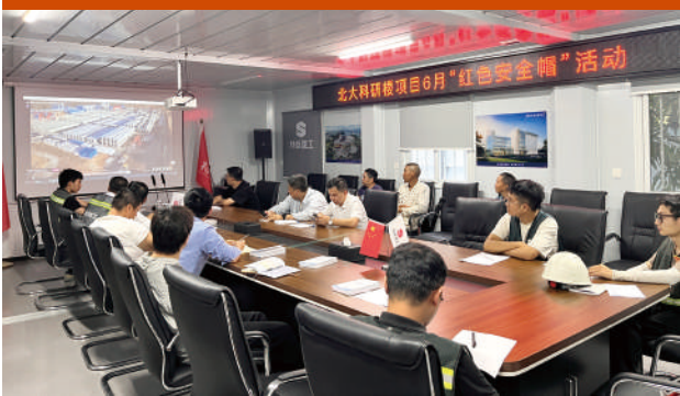
观看安全警示教育片

2025年6月27日，建筑工程二公司党支部指导北京大学深圳研究生院新兴交叉学科教学与科研大楼（一期）项目深入开展“红色安全帽”安全生产月系列