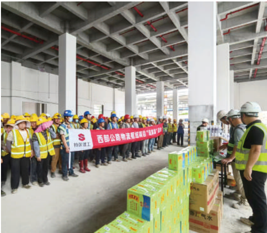
给项目一线员工“送清凉”

2025年6月18日，建筑工程七公司党支部指导西部公路物流枢纽项目开展“红色安全帽”活动——消防知识宣讲暨“送清凉”活动。活动中，项目部邀请到潭头消防站的消防员们开展消防知识宣讲。消防员们结合施工现场的实际情况，用通俗易懂的语言，深入浅出地讲解了应急逃生处置方法以及施工现场发生火灾的正确应对措施。还手把手指导工友操作灭火器，详细讲解“提、拔、握、压”的操作要领。在消防员的耐心指导下，工友们掌握了这些关键的消防技能。活动现场，项