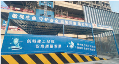
施工电梯标化双层防护棚