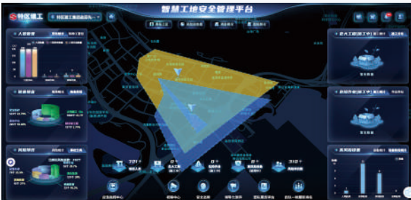
智慧工地安全管理平台

1. 智慧工地管理平台：建安集团引入智慧工地管理平台，整合人员管理、设备管理、安全管理、应急管理等多个模块，达成施工现场的数字化、智能化管理。借助该平台，管理人员能够实时掌握施工现场的人员分布、设备运行状态、安全隐患排查治理情况等信息，并及时做出决策与调度。例如，在人员管理模块，记录人员的培训情况、工种信息等，以便对人员进行合理调配与安全管理。