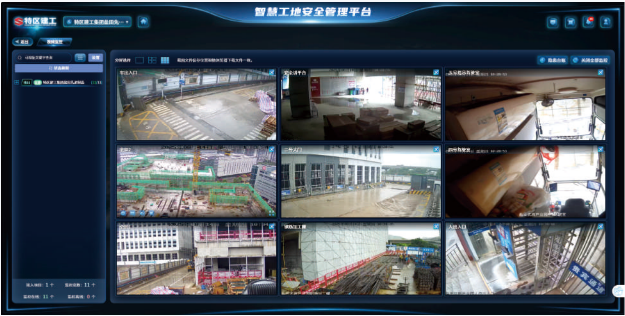
智慧工地安全管理平台

2. 安全隐患智能识别：运用人工智能图像识别技术，针对施工现场的视频监控画面开展智能分析，自动识别各类安全隐患，诸如人员未佩戴安全帽、未系安全带、施工现场物料堆放杂乱等情形。系统一旦识别出安全隐患，即刻发出预警信息，并将相关画面截图留存，以便管理人员进行核实与处理。借助安全隐患智能识别技术，显著提升了安全隐患排查的效率与准确性，切实弥补了人工巡查的欠缺。