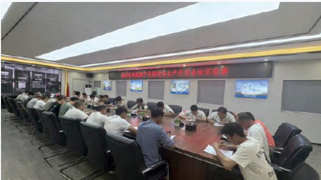
组织开展安全知识竞赛

2. 心理健康关怀：关注施工人员的心理健康状况，充分认识到心理因素对于安全生产的重要影响。于施工现场设立心理咨询室，并配备专业的心理咨询人员，为施工人员提供全面的心理咨询与辅导服务。通过开展心理健康讲座、实施心理疏导活动等举措，助力施工人员缓解工作压力、调适心理状态，以保持良好的精神风貌，切实防范因心理问题而引发安全事故。在项目施工高峰期，部分施工人员因工作强度较大、压力过重而出现焦虑情绪，心理咨询人员及时予以介入，借助一对一的心理疏导以及团体心理辅导活动，帮助他们有效缓解压力、调整心态，从而确保施工得以安全推进。