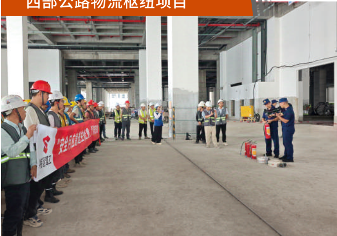
开展消防知识宣讲

2025年6月18日，建筑工程七公司党支部指导西部公路物流枢纽项目开展“红色安全帽”活动——消防知识宣讲暨“送清凉”活动。活动中，项目部邀请到潭头消防站的消防员们开展消防知识宣讲。消防员们结合施工现场的实际情况，用通俗易懂的语言，深入浅出地讲解了应急逃生处置方法以及施工现场发生火灾的正确应对措施。还手把手指导工友操作灭火器，详细讲解“提、拔、握、压”的操作要领。在消防员的耐心指导下，工友们掌握了这些关键的消防技能。活动现场，项