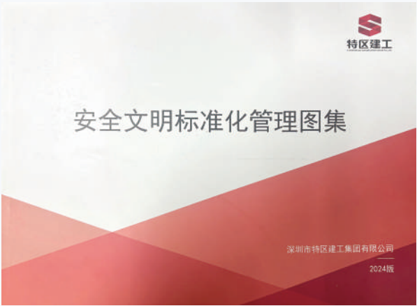
特区建工标准化图集

3. 定期考核强化记忆：定期组织安全标准化知识考核，将考核结果与员工绩效相挂钩，激发员工积极主动学习并掌握安全标准。考核内容涵盖安全法规、操作