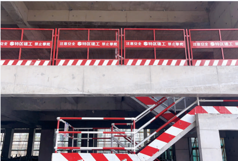
楼层临边工具式化防护

2. 安全检查标准化清单：制定详尽的安全检查标准化清单，明晰检查项目、检查标准、检查方法、检查频次等内容。安全管理人员依据该清单开展日常检查、专项检查及定期检查，以确保安全检查工作具备全面性、规范性与有效性。在清单中，针对高处作业的检查项目，明确规定了安全帽、安全带的佩戴要求，脚手架的搭建标准，安全网的张挂状况等检查内容与标准，让安全检查人员能够清晰直观地实施检查，及时察觉并整改安全隐患。